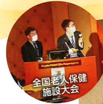
全国老人保健施設大会